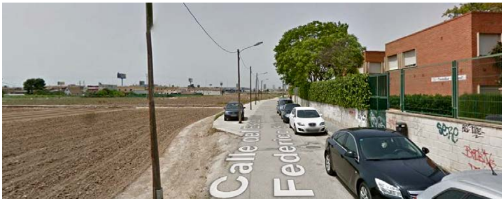
Calle del Escultor Federico. Colegio Municipal Castellar-L'Oliveral

En el continuo urbano aparecen lugares entre paréntesis que se materializan en colas de personas. Son los espacios de espera. Habitualmente se encuentran en vestíbulos, umbrales, accesos, zonas en transición. Por ejemplo, paradas de transporte público, el horno, el quiosco o la entrada/salida de un colegio. Precisamente, este último caso es el lugar donde se propone intervenir efímeramente en esta quinta edición, no sin antes reflexionar sobre el propio contexto, el barrio-pedanía-pueblo de Castellar-L'Oliveral en la periferia de Valencia, en el pre-parque de la Albufera, entre la huerta y la marjal. Aquí, el colegio Municipal tiene un espacio previo 'a medias', una ocasión para reflexionar sobre lo efímero de las esperas y a su vez, desvelar una oportunidad de adecuación de un espacio-mirador ahora ocupado por el vehículo privado.